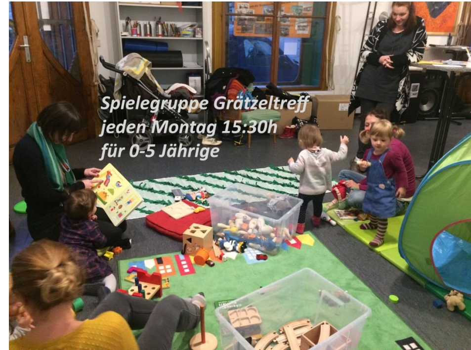
Spielgruppe Grätzeltreff jeden Montag 15:30h für 0-5 Jährige