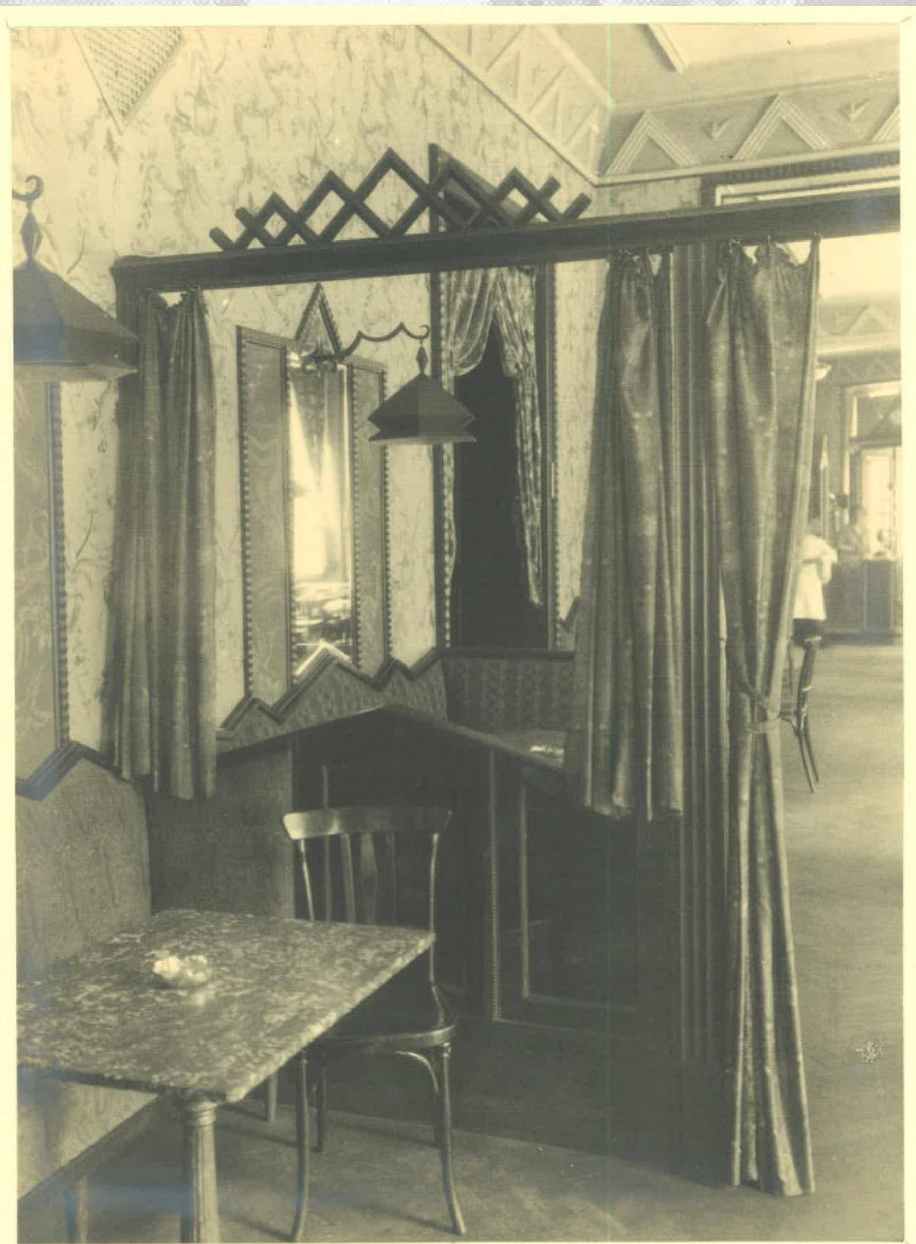
Kaffee Humboldt. Details im Tanzsalon (Ansicht vom Kasse Hönel)

Während des zweiten Weltkrieges wurde der Betrieb eingestellt, danach als Familiencafé mit soliden Preisen und aufmerksamer Bedienung beworben und schließlich 1952 geschlossen.