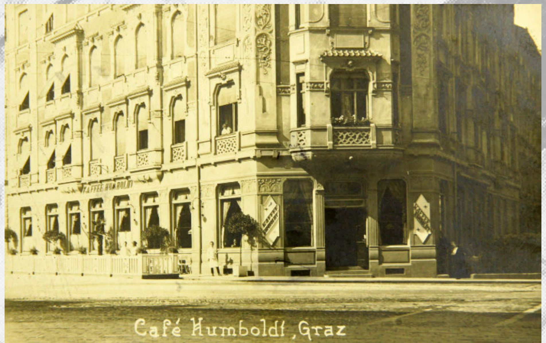
Café Humboldt, Graz

1926 kamen weitere Neuerungen hinzu, welche die vornehme Note des Kaffeehauses betonten, die Wandmuster zeigten eine glückliche Mischung von Chinesischem und Rokoko , in der neugeschaffenen Tanzdiele sahen graziöse Mädchen gestalten auf die Tänzer herab, Wandfüllungen, Spiegel und neue Beleuchtungskörper erhöhten das stimmungsvolle Bild. Neu waren Zentralheizung und Lüftung.